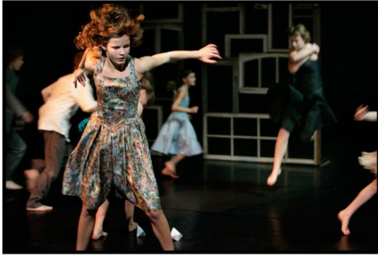
Satijn en Witte Wijn

Soumis par Bertrand Breuque le 11 novembre, 2010 - 12:19 dans la catégorie Festivals: Théâtre Montréal